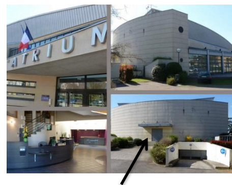
Quai de déchargement à gauche du parking public souterrain

Pour des expositions, conférences, réunions, congrès... vous pouvez louer les salles de l'Espace Culturel l'Atrium. Vous pouvez également organiser un moment convivial autour d'un cocktail pour vos soirées après un spectacle ou une conférence.