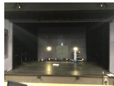
Vue depuis le gradin

Salle Chopin Auditorium de 139 places Idéal pour les conférences et réunions